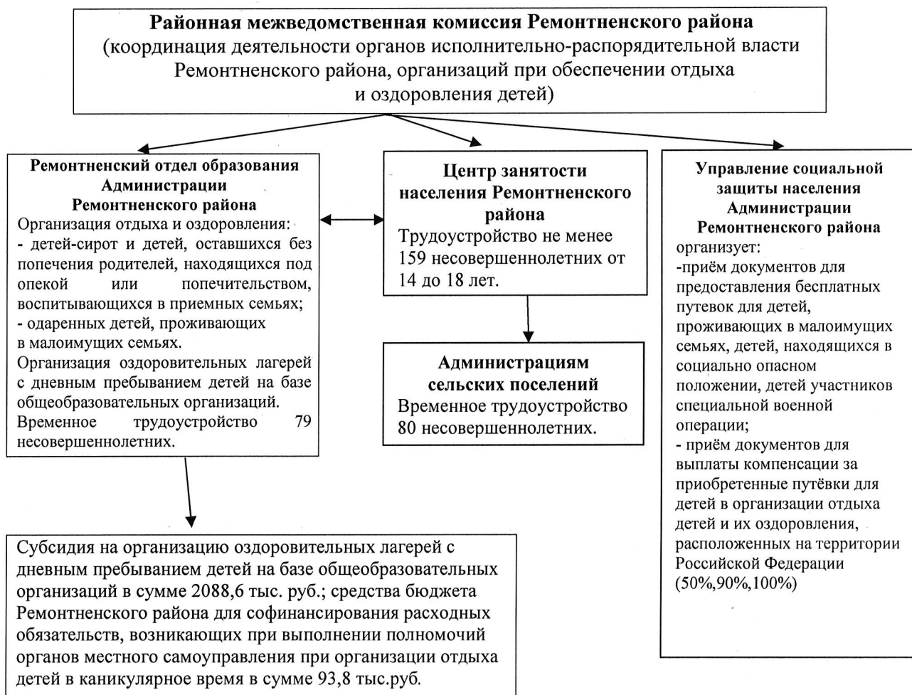
СХЕМА организации и обеспечения отдыха, оздоровления и занятости детей в 2026 году по Ремонтненскому району

Управляющий делами (руководитель аппарата) Администрации Ремонтненского района